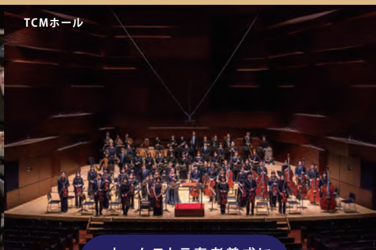
オーケストラ奏者養成に最適な環境