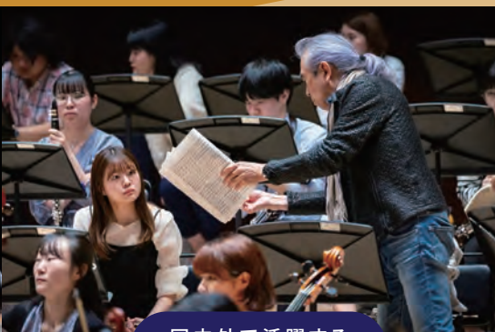
国内外で活躍する経験豊富な指導陣